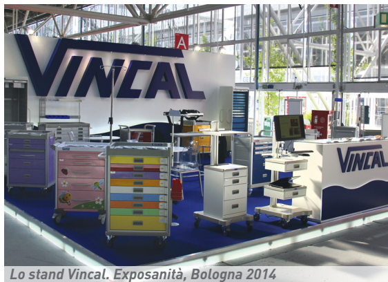
Lo stand Vincal. Exposanità, Bologna 2014

Vincal è un'azienda di forniture medico-ospedaliere con consolidate esperienze nazionali e internazionali, specializzata nella distribuzione di dispositivi medici, elettromedicali, ortopedici, medico-chirurgici ospedalieri e prodotti per emergenze sanitarie.